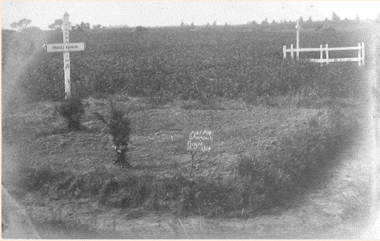
Eenzame Franse graven in de velden van Gozée

Op een steenworp van dit kolossale monument staat een bakstenen muurtje met een eenvoudige plaat waarop de namen van de gefusilleerde burgers staan. Schril contrast.