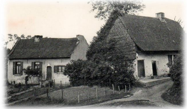
Dilbeek: de Spanjeberg, heel lang geleden