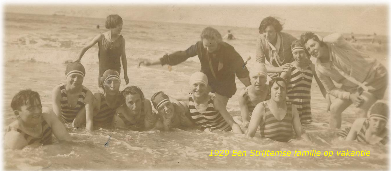
1929 Een Strijtemse familie op vakantie