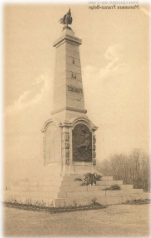
Het imposante " Monument aux Français " te Marchienne-au-Pont op de weg naar Beaumont, de poort naar Frankrijk.